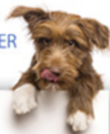
Tabela de Preços A partir de 1º de julho de 2014

Essa opção possui todas as coberturas do Pet Total em nossa rede credenciada e ainda lhe dá a liberdade de buscar outros especialistas e instituições, recebendo por reembolso até os limites contratados.